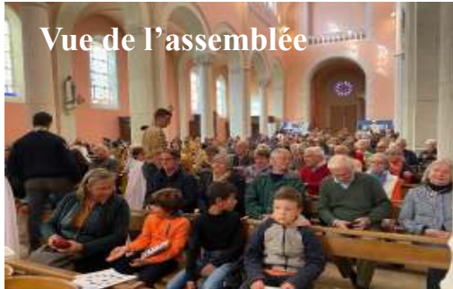
Vue de l'assemblée

plus être jamais seul, rappelle le chant.